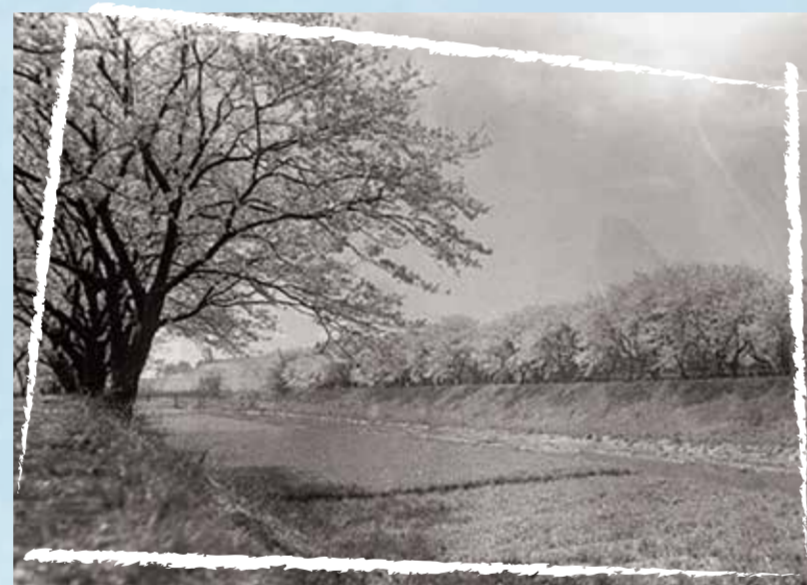
▲昭和初期の柏尾川の桜