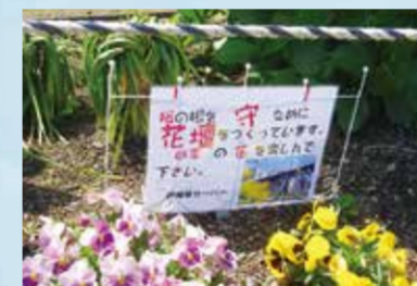
▲根の近くにお花を植える

桜の根の上の土が踏み固められると、水や養分が吸収しにくくなります。そのため、踏まれないように、お花を周りに植えています。他にも、桜の木から落ちた枯れ葉を集めてたい肥にしたり、桜を見分けるための数字が書かれたプレートをつけ、管理しています。そのプレートは地域の子どもたちに書いてもらっています。