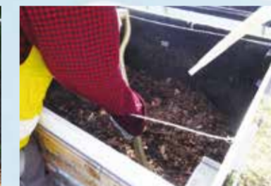
▲落ち葉たい肥作りの様子