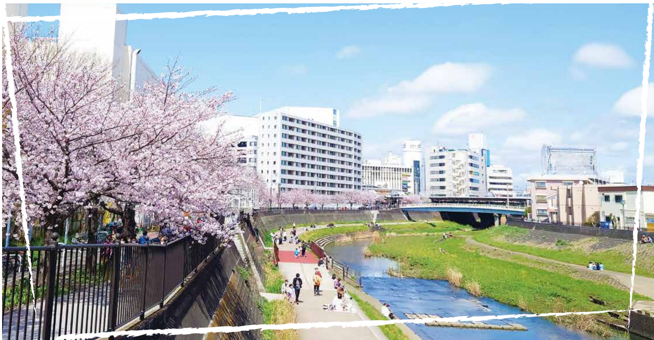
▲現在の柏尾川の桜

多くの人で賑わう戸塚区の名所「柏尾川桜並木」には長い歴史があります。それは、戸塚の桜をずっと残したいと思うたくさんの人によってつながれてきました。そんな柏尾川沿いに広がる桜の魅力を紹介します。