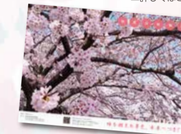
区役所9階93番窓口で配布中