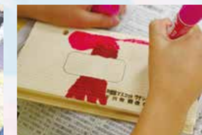
▲子どもがプレートを書いている様子