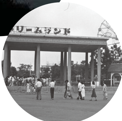
横浜ドリームランド