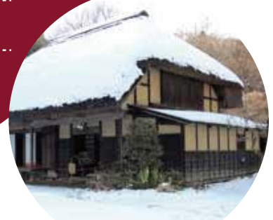
舞岡公園 小谷戸の里の雪景色