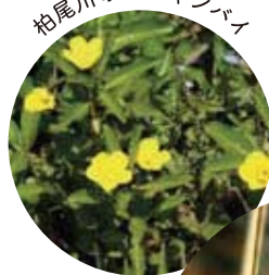
柏尾川のみずキンバイ