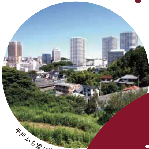
平戸から望む東戸塚