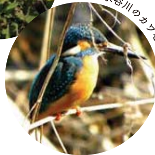
平戸永谷川のカササギ