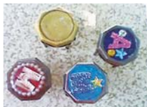
ベーゴマを自由に飾ろう

① 花壇作り隊 ▶土づくりから体験 6月 10日・17日・24日の日曜日(全3回)10時 ～12時 成人 持 手袋、長靴 甲5月11日 10時から 窓か 休 ② チューリップ球根掘 り 5月26日(土)・27日(日)10時～14時 ③ 初級グラウンド・ゴルフ教室 5月 21日(月)9時～11時※雨天中止 初 心者 ¥100円 持 クラブ、ボール※クラブ 貸出しあり(先15人) 休 ④ つるみブレ イパーク ▶デコベアを作ろう 6月3日(日) 10時～15時(¥ デコベア200円) 休 ⑤ 第6回ベーゴマ 大会 6月9日(土) 10時～15時 休