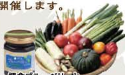
福倉ブルーベリーと西会津ミネラル野菜