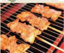
道志ポーク串焼き