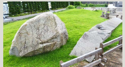
隣にあるもう一つの庭園「清風苑」