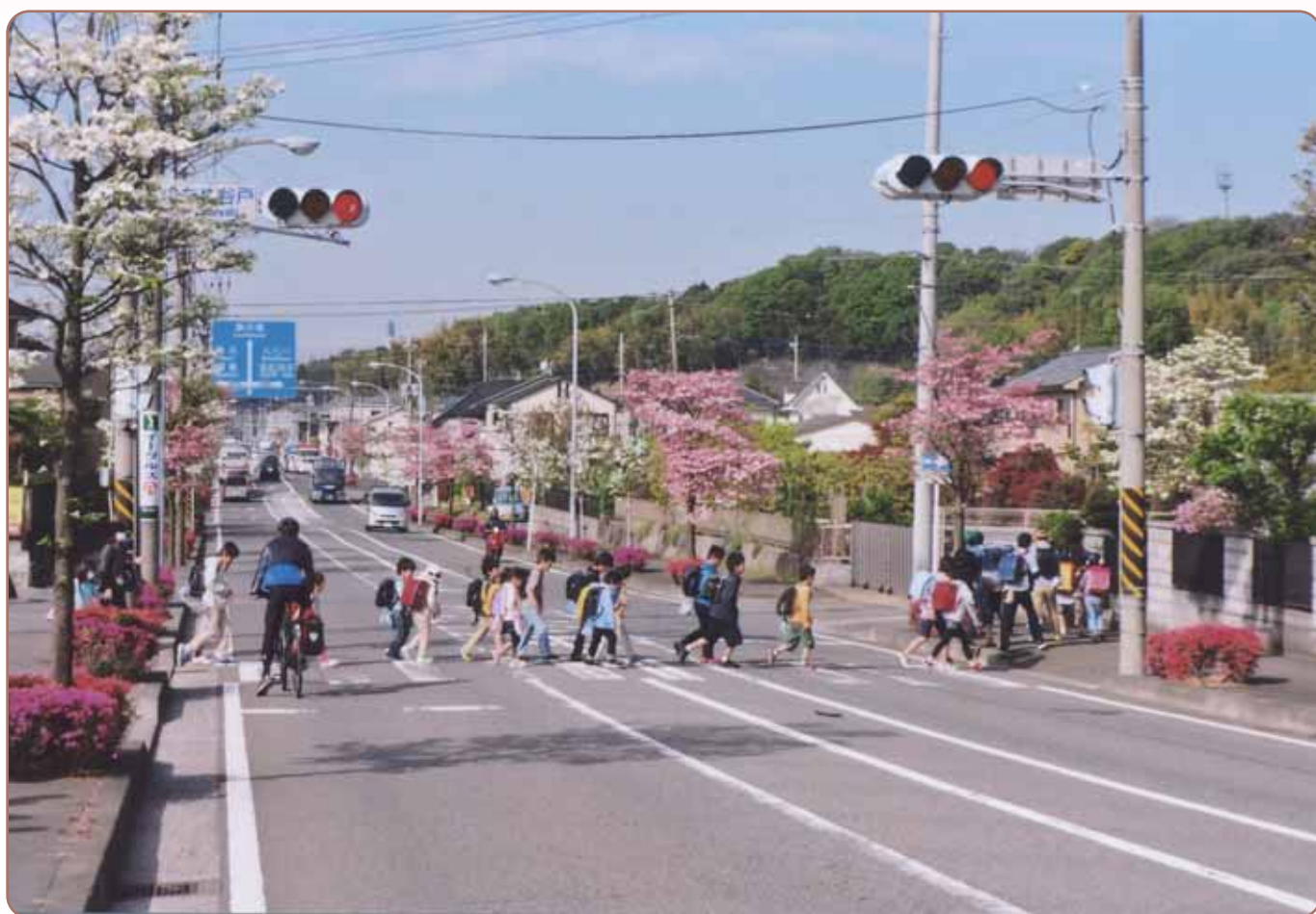
はなみずき通り（通称） とくもち ひゃっこくぼし 「徳持～百石橋西側」