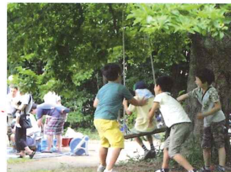
子ども達は思いきり自由な遊びを楽しめます

現場では苦情もいただきますが、プレイパークの趣旨をお伝えして、ご理解をいただいています。私が連合子ども会の会長や主任児童委員を受けたころから、プレイパークが地域とつながっていった気がします。地域の色々なグループが、企画持ち込みでまんまるに来てくれます。持込大歓迎です。“色々な子どもがいる、色々な大人がいる”そのことをすごく実感している今が、私にとっての地域デビューかな（笑）