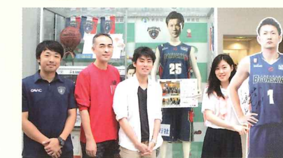
ビーコルのディスプレイの前で

横浜ビー・コルセアーズは横浜国際プールを拠点に活躍しているプロのバスケットボールチームです。ボランティアクルーのメンバーは高校生から70代までの約60名。会場設営、撤収、チケット確認、座席案内など色々な仕事があります。活動日、時間は選べるので自分のできる範囲で活動できます。 ※ボランティアクルー応募アドレス crew@b-corsairs.com 045-507-4544