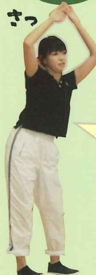
ココナッツミルクさん