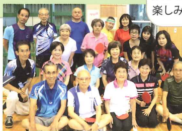
老若男女、楽しみは尽きません