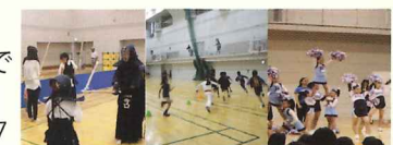
昨年度の様子(スポーツ体験、パフォーマンス)