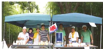
今日の持込企画はかき氷

運営にあたり、いつも心に留めていることがあります。仲間の一人が言った「誰かを締め出すようなあそび場をつくらないで」という言葉。誰でも参加OKをうたうなら、まわりの人とは違う人も、事情を抱えた人も、そうでない人もこの場所に来ると寛いで、気持ちが柔らかくなってしまおう、そういう場をつくり続けたいと思っています。私たちにできることは、まんまるに遊びに来た子が、楽しい時間を過ごせるよう心を配ること。ここで誰かと一緒に過ごしたいと思う子がいる限り、ずっとここに居続けようと思っています。