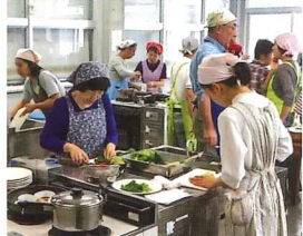
大人向けのクッキング講座