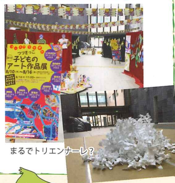
まるでトリエンナーレ？

区内全7館のコミュニティハウス(つづきの丘小、東山田中、勝田小、北山田小、川和小、中川中、都田小)の自主事業「子どものアート」での作品が区民ホールに賑やかに展示されました。(8/10~8/16) 会期中のワークショップの作品が最後に素晴らしいオブジェとなりました。