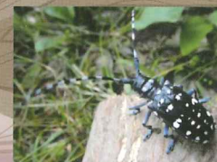
ゴマダラカミキリ