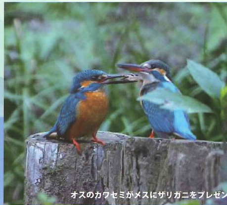
オスのカワセミがメスにザリガニをプレゼント