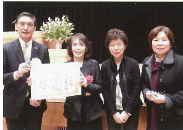
授賞式で、「結ぶ」のみなさん