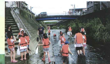
ジャブジャブと川に入ってクリーンアップ

※毎月第4日曜日には早瀬川親水広場愛護会主催の環境美化活動も行われており一緒に活動しています。