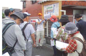
大山道を歩きながら要所のガイド

コースの下見は必ず2回は行います。歩けば歩いただけ発見があります。参加者を安全に誘導することは旅行会社での経験が役立ちました。ガイドをする時は、あまり詳しくすぎないように心がけています。自分の知識のポケットが10個あったらその中から1、2個出し、詳しく知りたい方にはさらに出していくようにしています。参加された方が興味を持つ入口を作ればと思っています。