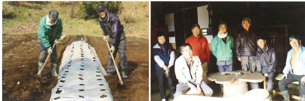
畑づくりは楽しいですよ

都筑区役所の講座をきっかけに立ち上がり、国重要文化財に指定されている「関家住宅」周辺で活動しています。畑は半年かけて堆肥をつくり、なるべく農業を使わない野菜作りをしています。鋤を持つことも初めてだったメンバーから経験者まで、みんなで工夫を重ねながら旬の美味しい野菜を作っています。「関家住宅」周辺の草刈り、落ち葉掃き、茅葺屋根の煤払いなどの環境保全にも携わっています。畑が楽しい！という仲間が集まり、地域の歴史的な建造物の環境を守っています。 ※現在メンバーの募集はしていません。