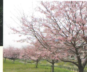
早瀬川の桜、ほっと和みます