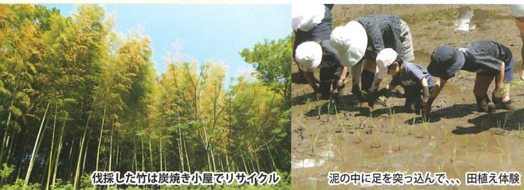
伐採した竹は炭焼き小屋でリサイクル