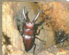
ノコギリクワガタ