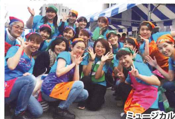
ミュージカル参加メンバー！

育児ミュージカル実行委員会 ……育児ミュージカルもっともっとIKUMINS3 開催