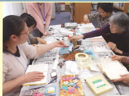
手に取る人をイメージして、修理。

本物の修理講座を受講した皆さんが、1月に中川西地区センターで、活動をスタートしました。繰り返し読まれる本、大切に読んでいてもどうしても傷んでしまいます。家庭では、セロテープなどで手軽に補修してしまいがちですが、実は逆に本を劣化させてしまいます。今回の修理のほとんどが、まずはセロテープをはがすところから始まりました。専用のノリやテープでいねいに修理をして、再び手に取っていただけるよう活動を続けていきます。