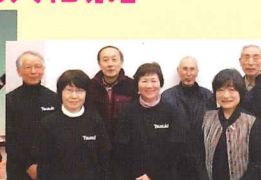
文化祭実行委員会展示部門の皆さん

舞台部門では、オープニングステージで「都筑三大パレエハイライト」が上演され、音楽や舞踊が披露されました。展示部門では写真・花・文芸・工芸・書道作品の展示や体験コーナーが設けられました。委員の皆さんは開催に備え昨年春より活動を開始し、開催間近は連日連夜の準備、開催期間中も緑の下の力持ちとして文化祭を支えました。来年も都筑の魅力がたくさん詰まった文化祭をお楽しみに！