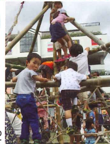
センター北駅前芝生広場のプレイパークにて

……こどもみらいフェスティバル開催 フェスを運営する子育て世代ボランティアの学びのための場づくりを実施。事前のワークショップには多くのボランティアが集い、フェス開催にあたっては主体的に運営に参加しました。