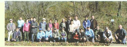
保全活動サポーターの皆さんと