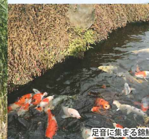
足音に集まる錦鯉

都筑区には「せせらぎ」と呼ばれる場所がいくつかあります。「ふるさと」をしのばせるまちづくりの一環として、田んぼのそばに小川が流れる昔の風景を残すため、新しい街の中に「せせらぎ」を再現しました。区内では「佐江戸せせらぎ水辺愛護会」、「都田江川水辺愛護会」、「みんなで浄念寺川せせらぎ緑道を守ろう会」の3つの愛護会が、地域の川や水辺の清掃、美化活動などを行い水辺の環境を守っています。