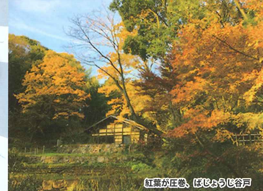
紅葉が圧巻、ばじょうじ谷戸