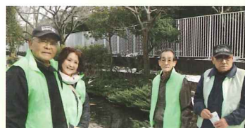
安部会長と水辺愛護会の皆さん