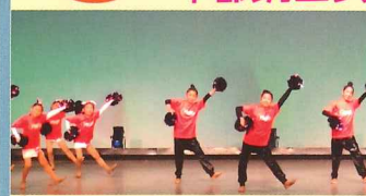
舞台でのパフォーマンス