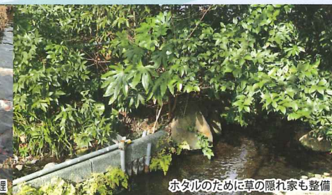
ホタルのために草の隠れ家も整備