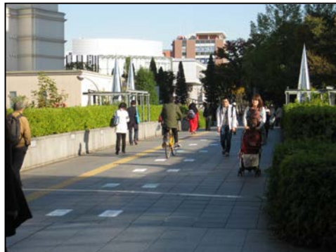
自転車歩行者専用道路

実験期間中、自転車利用者及び歩行者へのアンケート（平成 28 年 2 月 623／全 2000 票）及び通行状況の観測調査（平成 28 年 3 月）により効果の検証を行いましたのでご報告します。