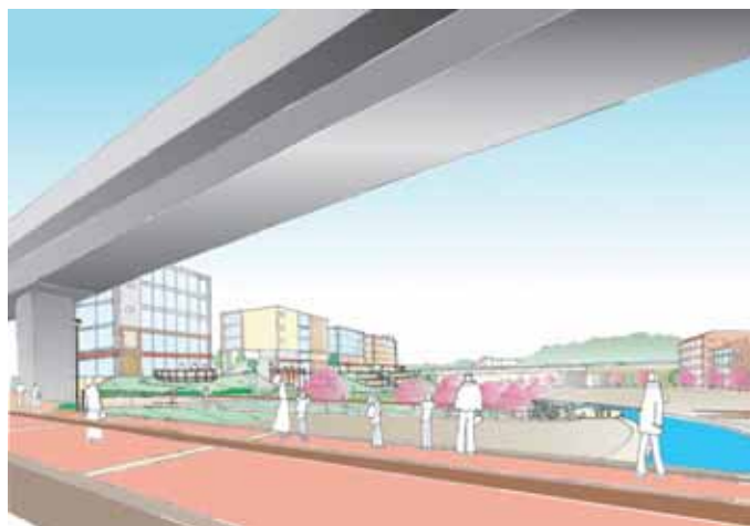
桜並木と五山を橋上で鑑賞する場所としてのセンター橋 (十字空間) の位置づけ (No.9)