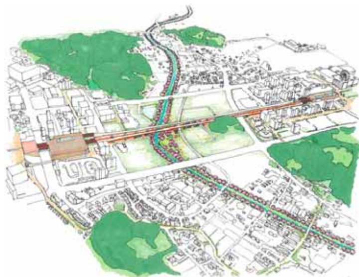
早湊川桜堤の連続化 (No.3)