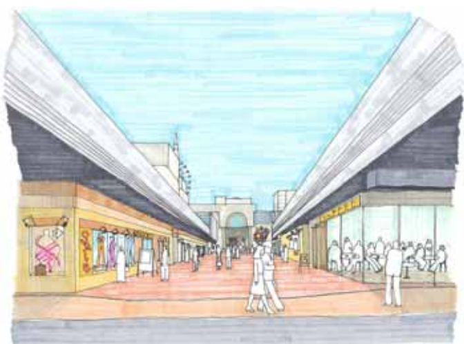
歩行者空間に顔を向けた沿道商店街の形成 (No.10)