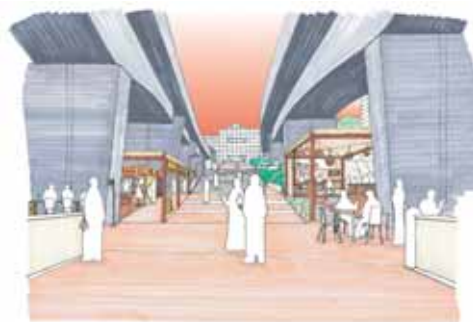
早湊川を起点とした商店街のゾーン分け (屋台村等) (No.11)