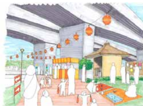
歩行者空間を活用した子育てイベント (No.16)