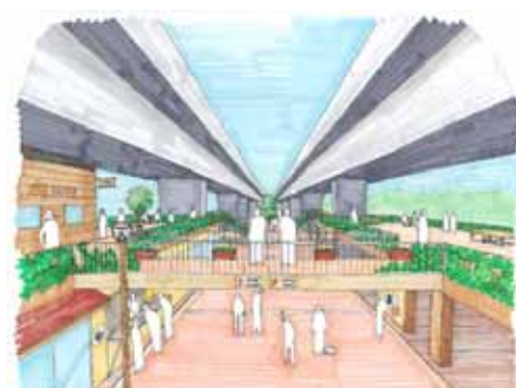
屋上利用のできる商店街の形成 (No.12)