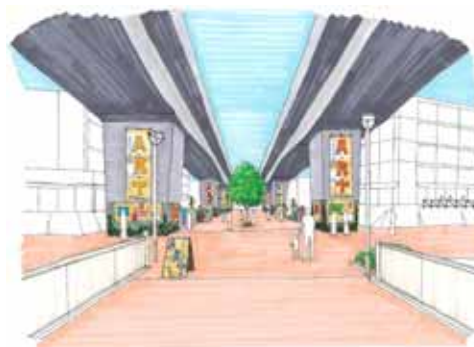
北と南を結ぶ芸術空間づくり (No.13)