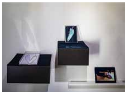
The Pond of Melting Pureness 透きとおる夢溶ける水面/2019年/アクリル、鏡、ワックス

■ フェローアートギャラリー 井口直人展 障害のあるアーティストたちの表現を紹介するミニギャラリー/6月1日(月)～7月26日(日)9時～21時/☎ ■ ショーケースギャラリー 宮内由梨展 エントランスロビーに設けたショーケースの小空間を使って、新進作家の作品を紹介しています/6月1日(月)～7月8日(水)9時～21時/☎