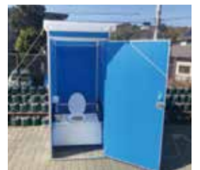
ハマッコトイレ(折本小学校)