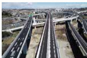
横浜青葉ジャンクション(青葉区下谷本町)