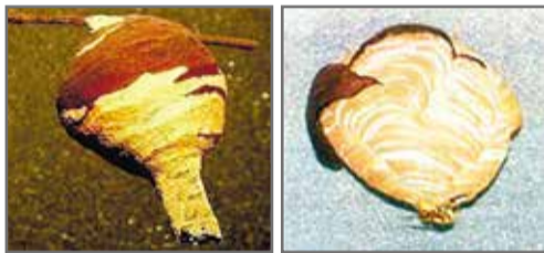
コガタスズメバチの巣 キイロスズメバチの巣