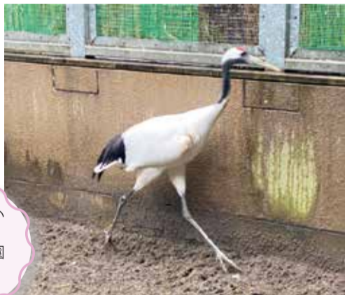
来園して間もないころの様子(よこはま動物園ズーラシア)

よこはま動物園では、2020年3月24日に、千葉市動物公園からタンチョウ(愛称：オタル)が来園しました。ぜひよこはま動物園初となるタンチョウの姿を見に来てください!