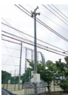
防災用スピーカー(佐江戸公園)

②鶴見川流域の浸水想定区域への広報を強化するため、避難情報を伝達する防災用スピーカーを川和車両基地に1基整備します。【総務課】