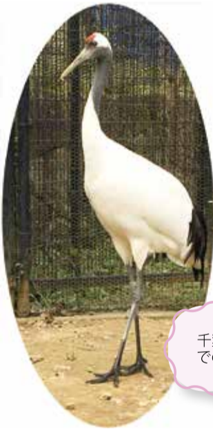
千葉市動物公園でのオタル(メス)

タンチョウは中国東北部やロシア極南東部で繁殖し、中国東海岸沿いや朝鮮半島で越冬する集団と、北海道に留鳥として生息する集団が存在します。アイヌ語では「サルルンカムイ(湿原の神)」とも呼ばれており、日本で繁殖する唯一の野生の鶴でもあります。しかし、そんなタンチョウは世界に2800羽程度しか生息しておらず、日本では特別天然記念物に指定されています。