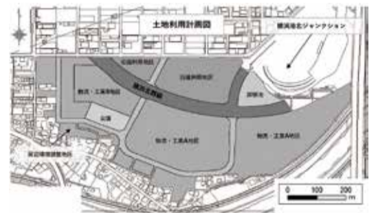
川向町南耕地地区