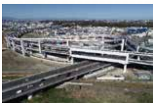
横浜港北ジャンクション(川向町)