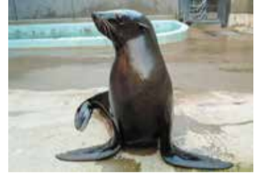
北京オリンピックにちなんで「王(ワン)」と名付けられました

去年11月には鳥羽水族館から「ワン(推定12歳、メス)」が来園しました。初めて運動場に出る練習をした時は、そのまま2日間も寝室に帰ってこなくなり、ずいぶん心配しました。水量約400tの広いプールでのびのび泳ぎたかったかもしれませんね。ワンは細い見かけによらず、低く野太い声で「オアーツ!」と鳴きます。たくましい鳴き声にもご注目ください。