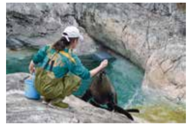
運動場に出る練習。声をかけながら一緒に移動し、緊張をほぐしていきます