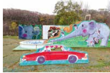
画像は一昨年の様子

楽しみながら動物のことを知ってもらえるようなイベントを開催します / 3月27日(土)~4月4日(日) / ころこロッジ、ころころ広場など / 画