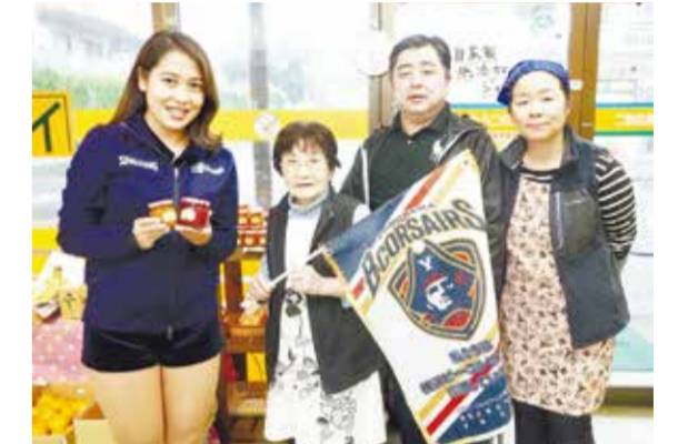
横浜ビー・コルセアーズ 商店街訪問

区民の皆さんのふるさと意識の向上や、異文化交流によるつながりづくりを目的としたイベントを開催することで、街のにぎわいづくりを目指します。 また、商店街の魅力地域に発信し、商店街活性化を図ります。 ▶都筑区民まつりの開催など