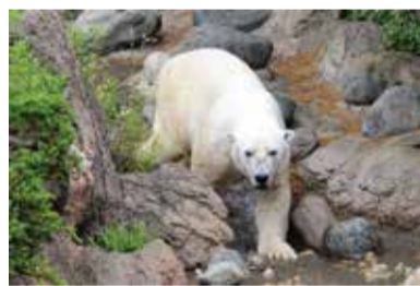
ホッキョクグマの質問についてのパネルも展示しています。

飼育員が、一昨年に募集した来園者からの質問にお答えしたパネルを展示します / 5月10日(月)まで / アマゾンセンター / 窓