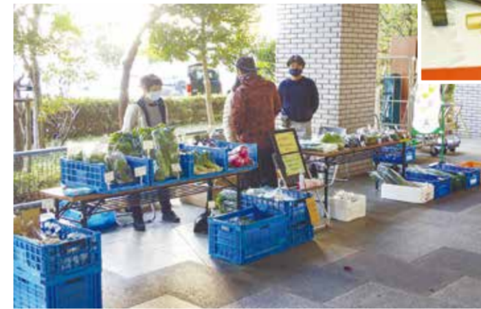
こうじょうのキラキラ(ものづくり体験)

区内の製造業の持つ高度なものづくり技術や独創的な製品、区内でとれた新鮮な都筑野菜などの「メイドインつづき」をPRし、販路開拓や地産地消を支援します。 ▶子どもたちのものづくり体験イベント、都筑野菜を使った飲食店を巡るスタンプラリーなど