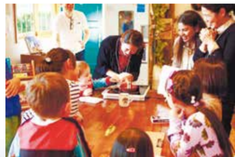
区内NPO法人の活動の様子

地域社会が抱える個別課題の解決を支援するため、地域支援の種(たね)をまき、地域運営の持続可能性を高めます。 ▶「コミュニティ応援アドバイザー」の派遣、NPO法人情報誌の発行など