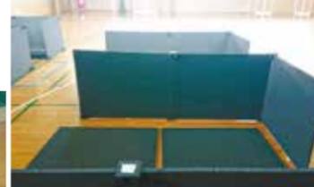
避難所用間仕切り(感染症対策)