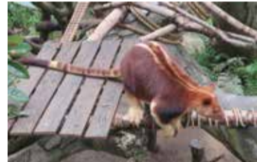
背中と尾の模様が特徴的(モアラ)