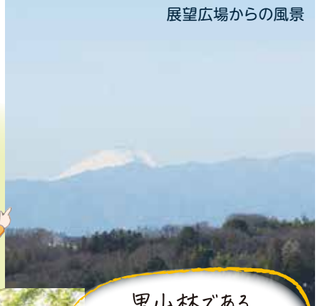
展望広場からの風景