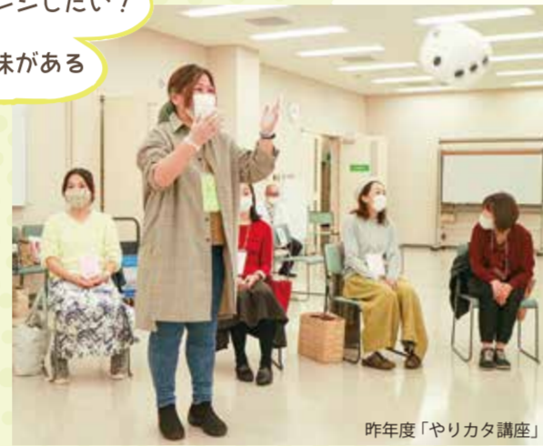
昨年度「やりカタ講座」

やりたいことをカタチにする講座 略して「やりカタ講座」。 この講座は、身近な地域に居場所を生み出す「場づくり」講座です。居心地の良い場がほしいと思っている人、ずっと温めていたアイデアを実現したい人、今だからできることに挑戦したい人、そんな人にお勧めの講座です。受講した仲間と共に地域に自分たちの「場」を作り出しましょう。(日程の詳細は区役所からのお知らせ)