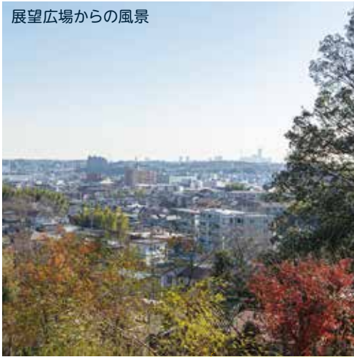
展望広場からの風景