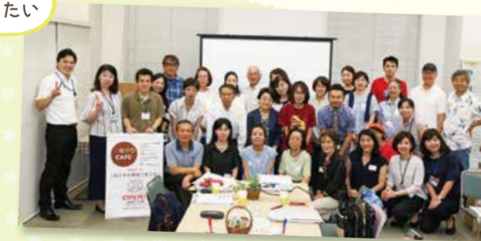
※この写真は令和元年度に撮影したものです