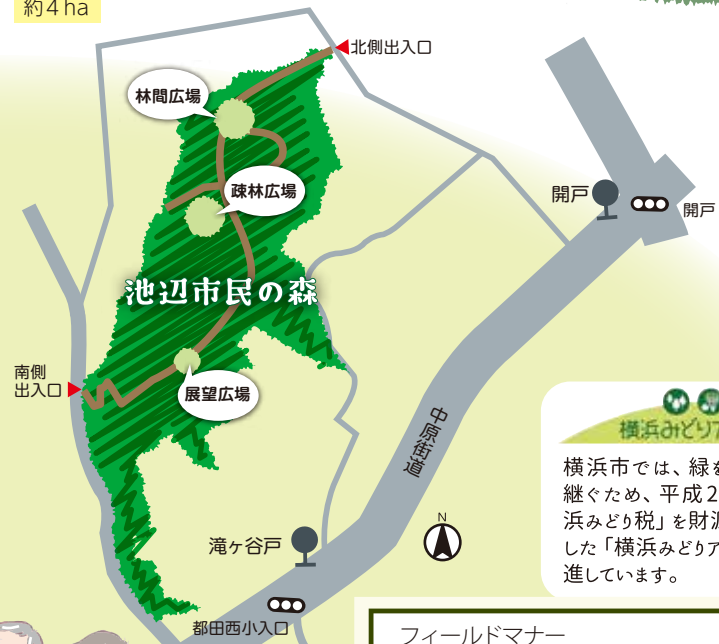
横浜みどりアップ計画

横浜市では、緑を次世代に引き継ぐため、平成21年度から「横浜みどり税」を財源の一部に活用した「横浜みどりアップ計画」を推進しています。