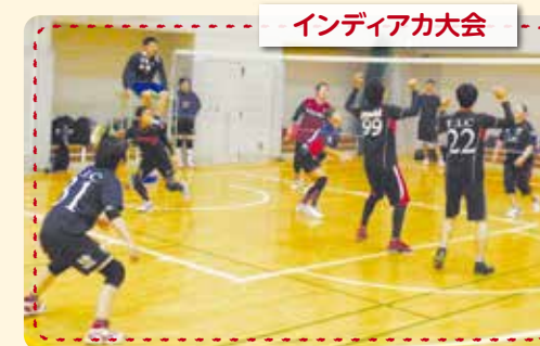
インディアカ大会

区には11の種目団体で構成される都筑区体育協会があります。各種目団体では区民大会や講習会などを開催しています。新型コロナウイルス感染症の影響により、中止となった区民大会も多数ありますが、これまで通り、区民大会ができるようになった際にはぜひご参加ください!!