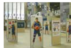
区役所1階でのパネル展