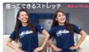
座ってできるストレッチ広報動画

2017年3月13日に「ホームタウン活動の協力に関する基本協定」を横浜ビー・コルセアーズ、都筑区役所、都筑区連合町内会自治会で締結しました。三者は協力しながら、区においてビーコルがホームタウン活動を円滑に推進するため、さまざまな取組を実施しています。