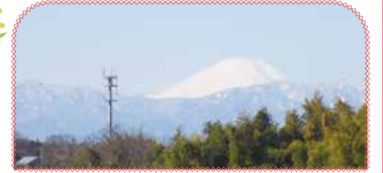
折本農業専用地区からみた風景

🔍 つづき みどりと花のまち巡り 🔍 検索、📄 必要事項と参加希望人数、参加希望者全員の👤・👤を明記し、🔄 ※手話通訳・要約筆記などが必要な人は申し込み時に併記してください。