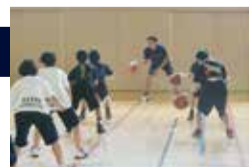
区内中学生を対象としたバスケットボール教室の様子