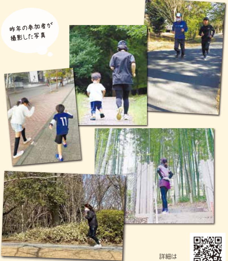
詳細はこちらから