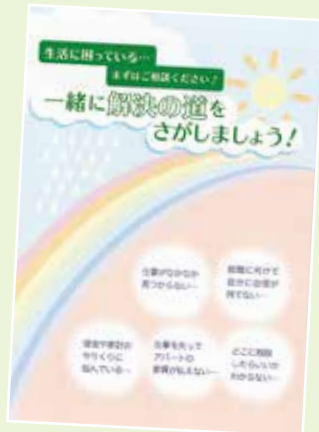
区役所で配布している制度案内チラシ