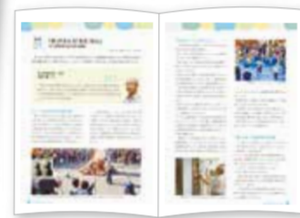
自治会町内会活動紹介冊子