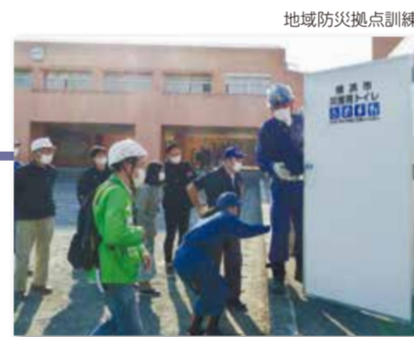
地域防災拠点訓練