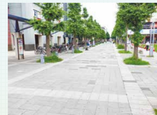
センター北駅周辺

センター北駅周辺の歩道について、平板舗装のがたつきや水たまりを改善し、安全性を向上するため、舗装の改修工事を行います。