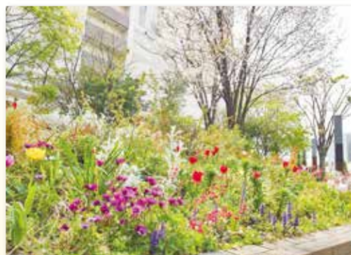
ナチュラルガーデン (センター南駅周辺)