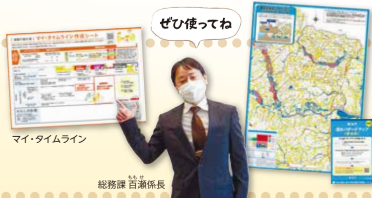
マイ・タイムライン