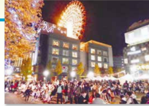
ドイツクリスマスマーケット in 都筑