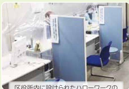
区役所内に設けられたハローワークの就労支援窓口「ジョブスポット都筑」

そんなお困りごとはありませんか? そんなときは区役所3階38番の窓口にご相談ください。区役所では支援員が一人ひとりの状況に寄り添いながら「オーダーメイド」の支援を行っています。