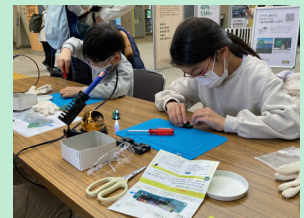
エコ活フェアの様子

都筑区では、基本目標の実現に向け、上記の他にも様々な事業・取組を実施しています。