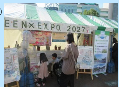
区民まつりにおけるPRブースの様子