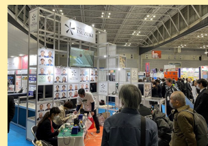
テクニカルショウヨコハマ2024