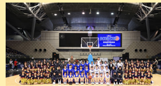
©B-CORSAIRS 都筑区内中学校選抜 ビーコルカップ