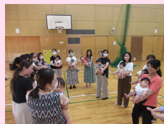
赤ちゃん会の様子