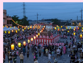
自治会町内会の夏祭りの様子