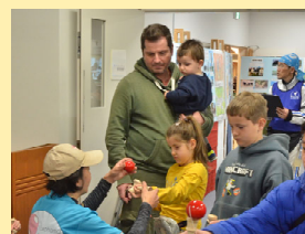
交流イベントの様子