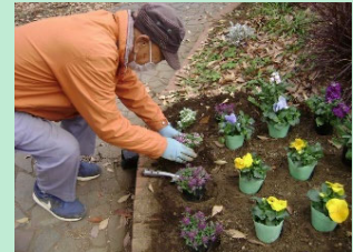
ハマロード・サポーターの活動の様子